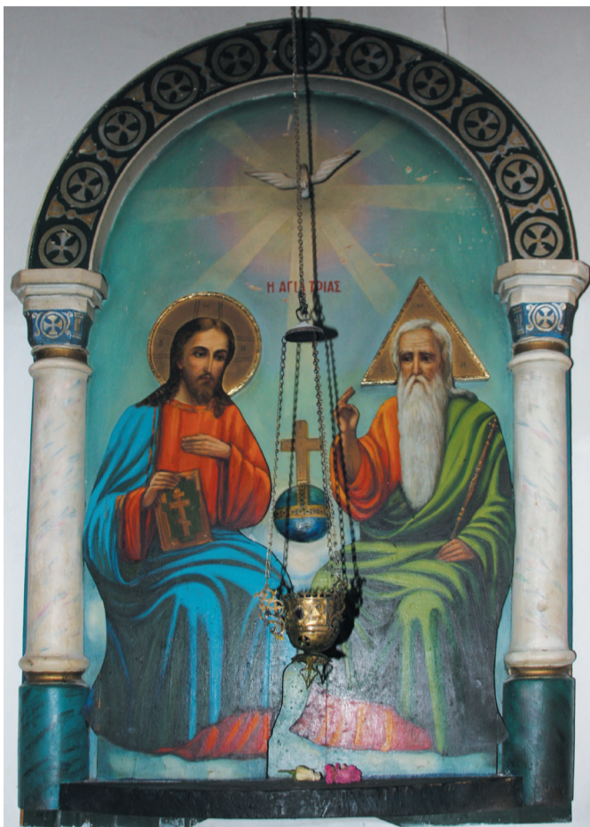
Икона Св. Троицы (H Αγία Τριάς) в греческой церкви

10 января 1916 г. Сухумское Эллинское общество в лице своих уполномоченных обратилось к Его Преосвященству, Пресвятейшему Сергию, Епископу сухумскому, с прошением о возбуждении перед Святым Синодом ходатайства об образовании из проживающих в Сухуме и его окрестностях греков особого прихода при вновь выстроенной ими церкви, об утверждении штата при сей церкви в составе двух священников и двух псаломщиков, об отпуске казенных денежных средств на содержание сего штата, о выделении из Соборного прихода в самостоятельный всех греков, проживающих как в Сухуме, так и в его окрестностях и образовании одного греческого прихода. В прошении подчеркивалось, что выделение это не повлияет на доходы Кафедрального Собора, так как при нем останутся «все русские и мингрельцы с грузинами, религиозные нужды коих только и могут удовлетворить соборные священники».