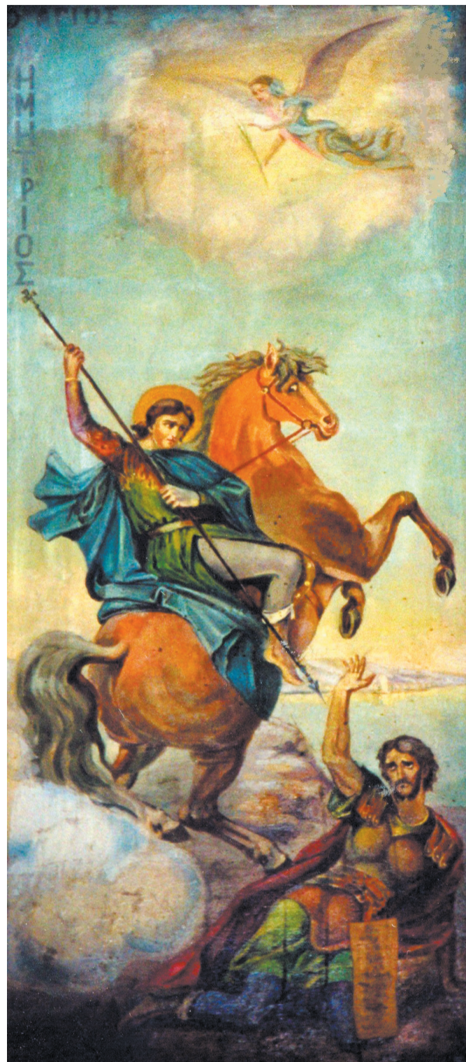
Икона Св. Димитрия (O Άγιος Δημήτριος) в греческой церкви.

4 мая 1917 г. Святейший Правительственный Синод Российской Православной Церкви определил при Сухумской греческой церкви открыть самостоятельный приход с причтом из двух священников и двух псаломщиков, с отнесением содержания сего причта на местные средства.