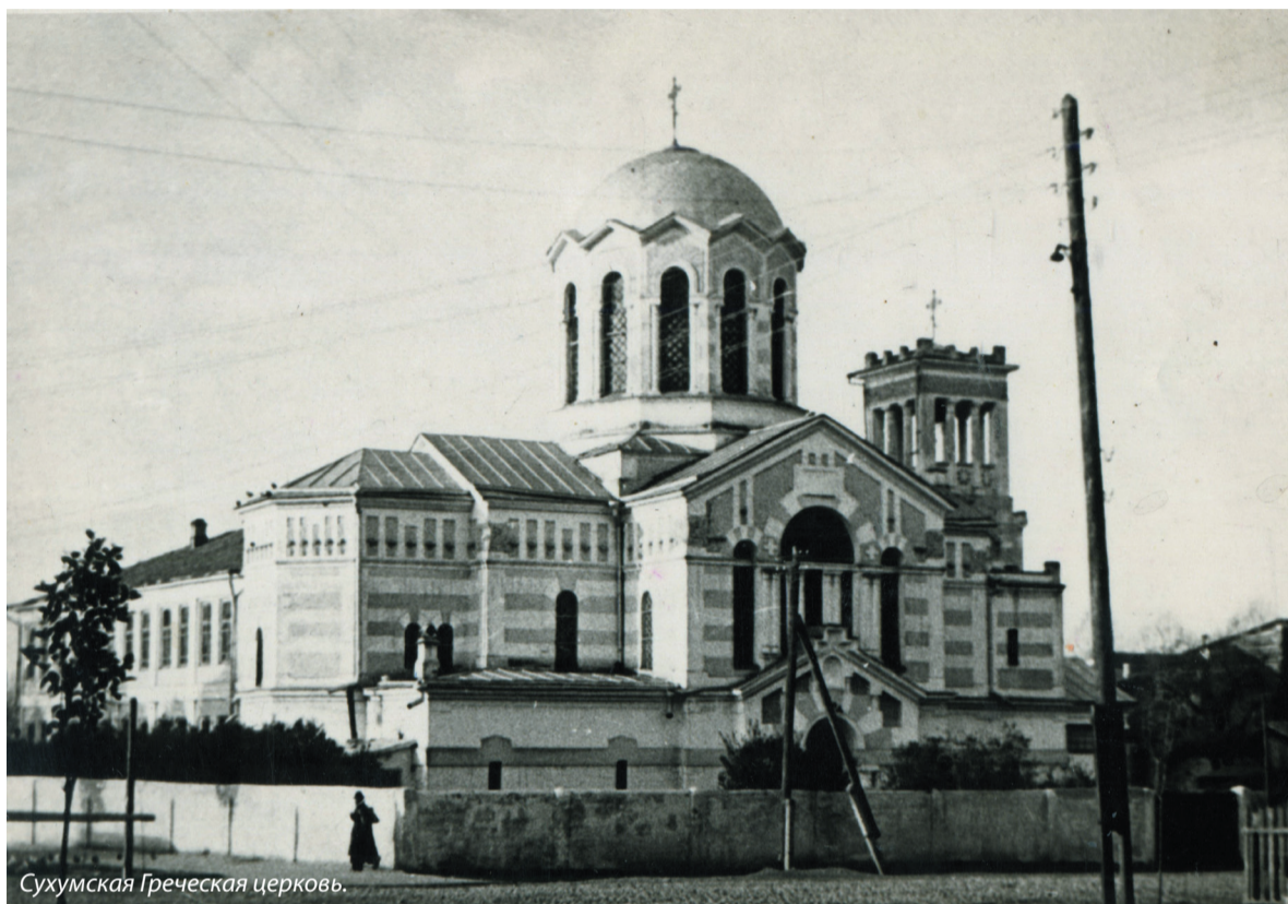
Сухумская Греческая церковь.