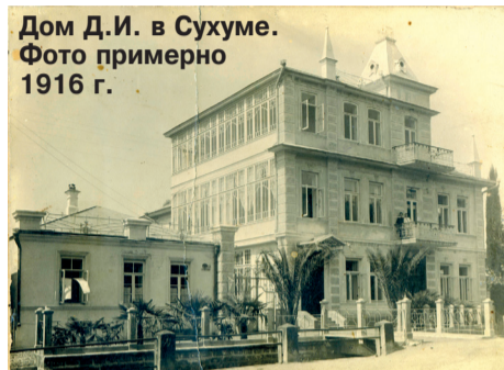
Дом Д.И. в Сухуме. Фото примерно 1916 г.