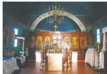
Внутреннее убранство церкви

Итак, к концу апреля 1918 г. она была полностью отстроена и 29 апреля 1918 г. как нам сообщает сухумская греческая газета «Морфосис» – стал днем ее освящения. Церковь во имя Преобржения Господня (Μεταμορφώσεως του Σωτήρος ) построена на территории греческого села Элефтерохори (Свобода), позже в советское время переименованном, а вернее переведенном на грузинский лад - Тависуплеба. Рядом находилась другая греческая деревня – Бурч (Бырцха, Верхняя и Нижняя). А непо-