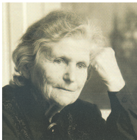
Автор: Адиле Аббас-оглы