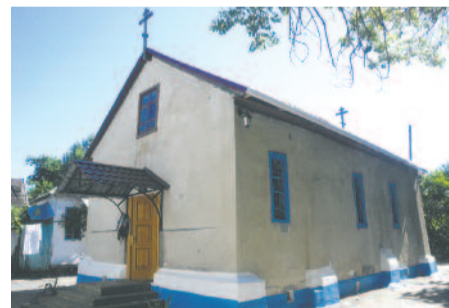
Церковь Преображения Господня

В городе на тот момент было два православных храма. Первый- это русский Кафедральный собор во имя Александра Невского в самом центре города, и второй - совсем недавно построенный (1915 г.) и освященный в 1917 г. Греческий храм