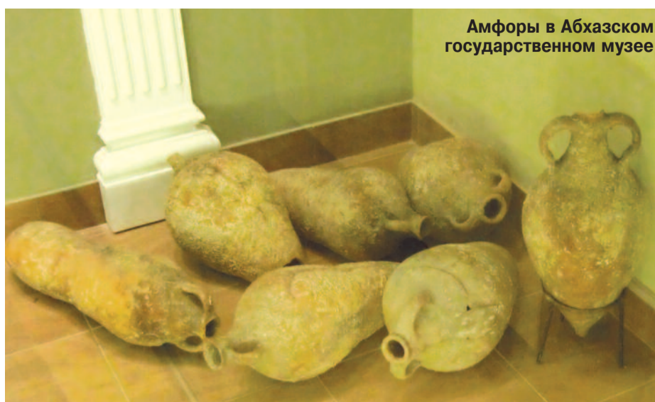
Амфоры в Абхазском государственном музее