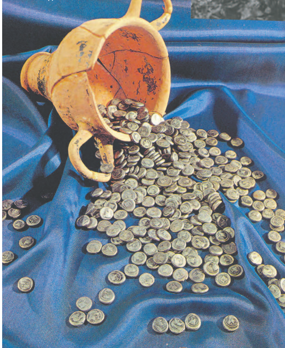
Античный сосуд с греческими монетами, т.н. «колхидками»

стоянии от берега, рыбаки давно производят сборище устриц и мидий руками со стен огромной башни, выдающейся с глубины около 10 метров и, кажется, на расстоянии до 200 саженой от берега; башня эта не доходит метра три до поверхности».