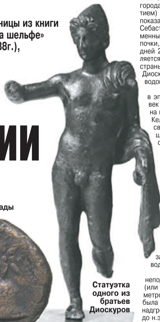
Статуэтка одного из братьев Диоскуров