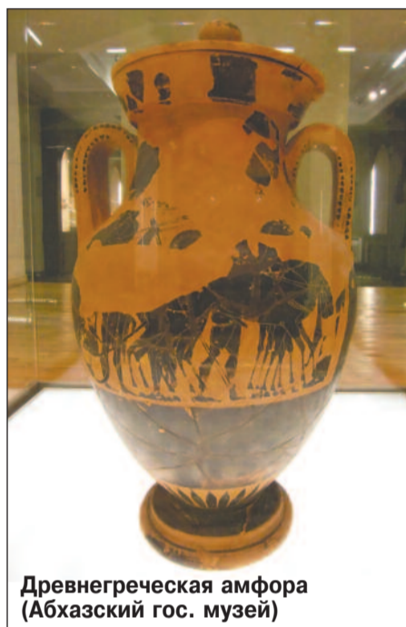
Древнегреческая амфора (Абхазский гос. музей)