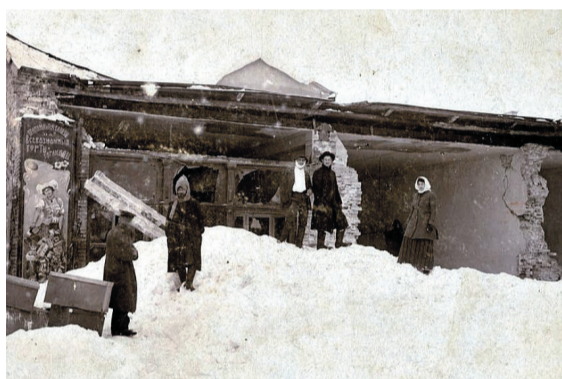
Рухнувшее от снега здание Алафузова в 1911 г.