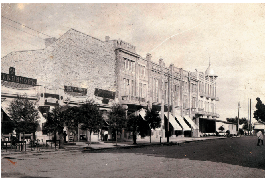
Здание К.Н.Алафузова (слева). Фото 1912 г.

В Сухуме в 1921 г. все частные типографии города были объединены в одно государственное предприятие, получившее в последующем году имя