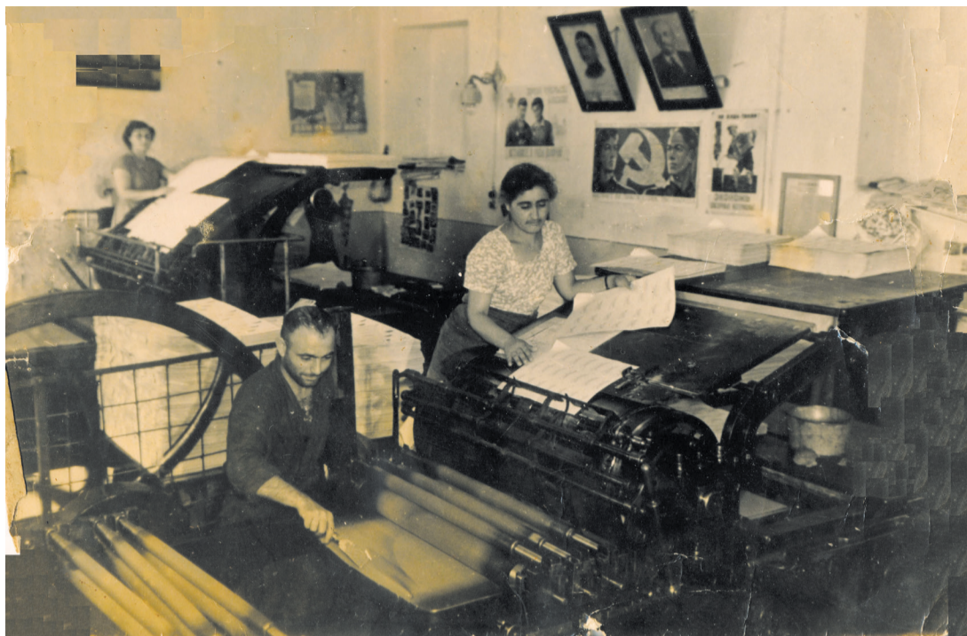
Типография в бывшем здании Алафузова.