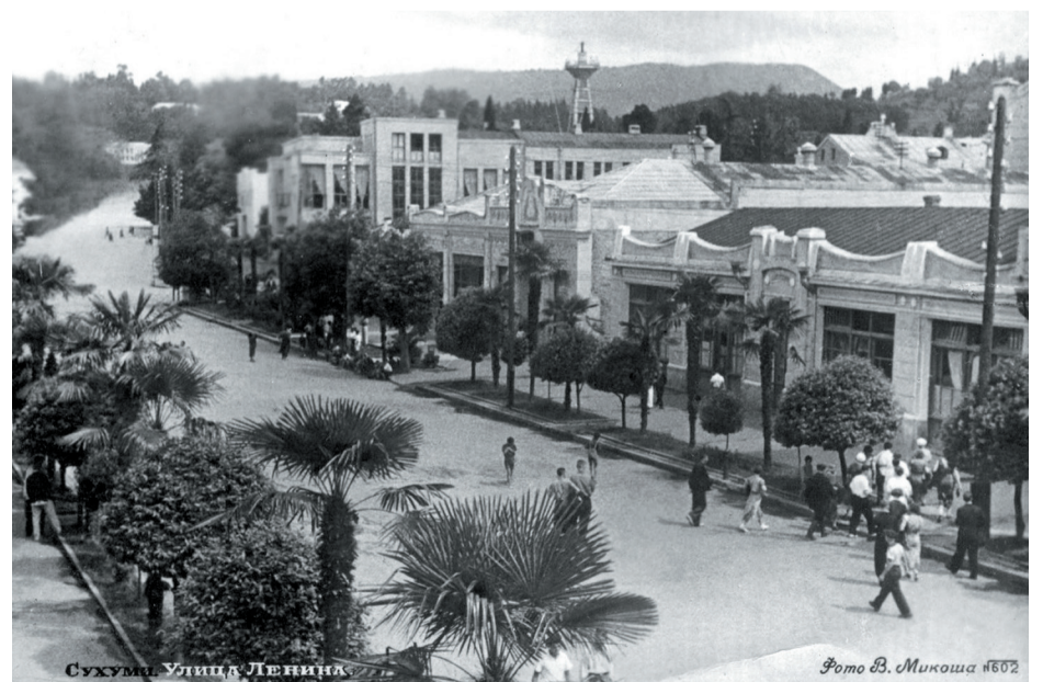
Здание К.Н. Алафузова справа. 1940-е годы.