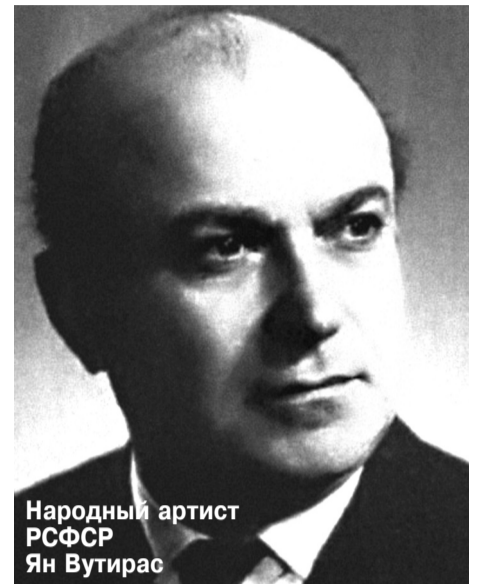
Народный артист РСФСР Ян Вутирас