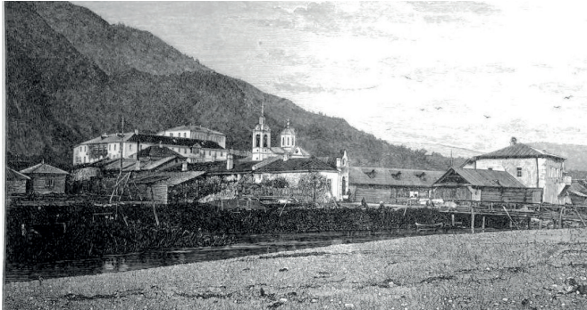
ВИД НОВО-АФОНСКОГО СИМОНО-КАНАНИТСКОГО МОНАСТЫРЯ С ЮЖНОЙ СТОРОНЫ