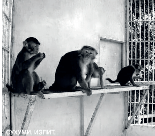
СУХУМИ. ИЗПИТ. В ОБЕЗЬЯННОМ ПИТОМНИКЕ