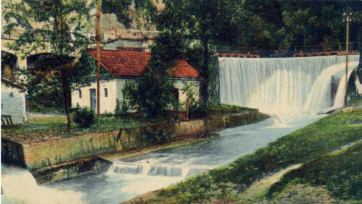
РУКОТОВОРНЫЙ ВОДОПАД В НОВОМ АФОНЕ ПОЯВИЛСЯ ПОСЛЕ ВОЗВЕДЕННОЙ В 1882 Г. МОНАХАМИ АРОЧНОЙ ПЛОТИНЫ НА РЕКЕ ПСЫРЦХА, КОТОРАЯ СТАЛА ЧАСТЬЮ ПЕРВОЙ В РОССИИ ГИДРОЭЛЕКТРОСТАНЦИИ.