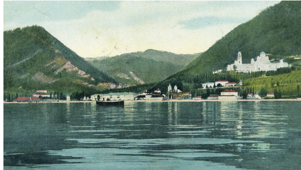
МОНАСТЫРЬ НОВЫЙ АФОН. ОБЩИЙ ВИД С МОРЯ