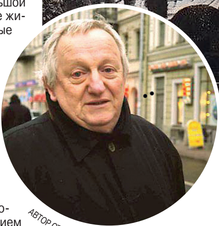
АВТОР СТАТЬИ: ИГОРЬ ГЕЛЬБАХ

ливаться по набережной во второй половине дня, сидеть в кафе и пить сухое вино, разглядывая фланирующих по набережной людей.