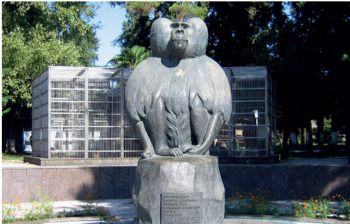
СУХУМСКИЙ ОБЕЗЬЯНИЙ ПИТОМНИК

цию, а позднее руководил раскопками древнего Цибелиума.