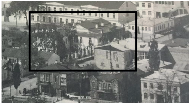
«ДВОРЕЦ КОМНИНО» В РАМКЕ НА СТАРОМ ФОТО.