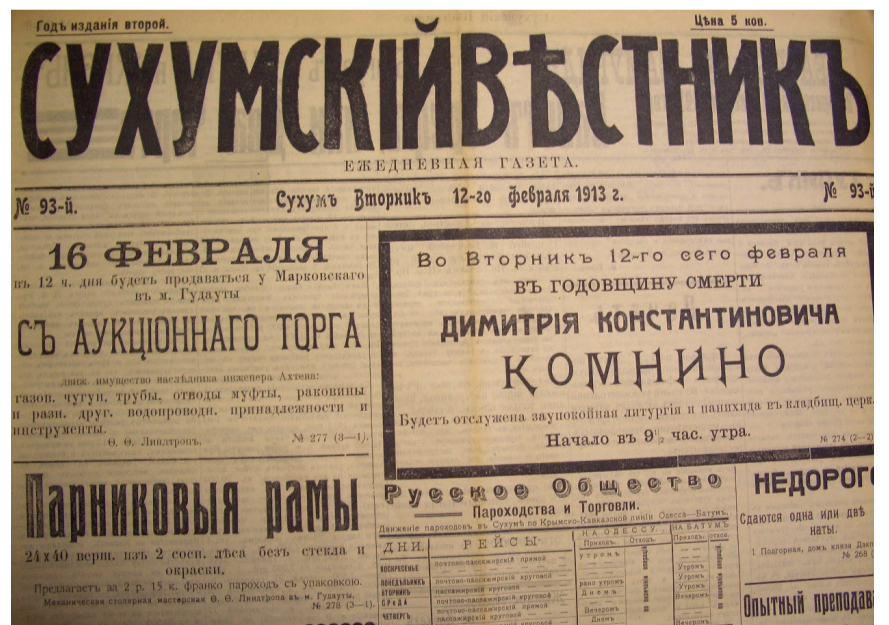
ОБЪЯВЛЕНИЯ В СУХУМСКИХ ГАЗЕТАХ КАСАТЕЛЬНО КОНЧИНЫ Д.К. КОМНИНО.