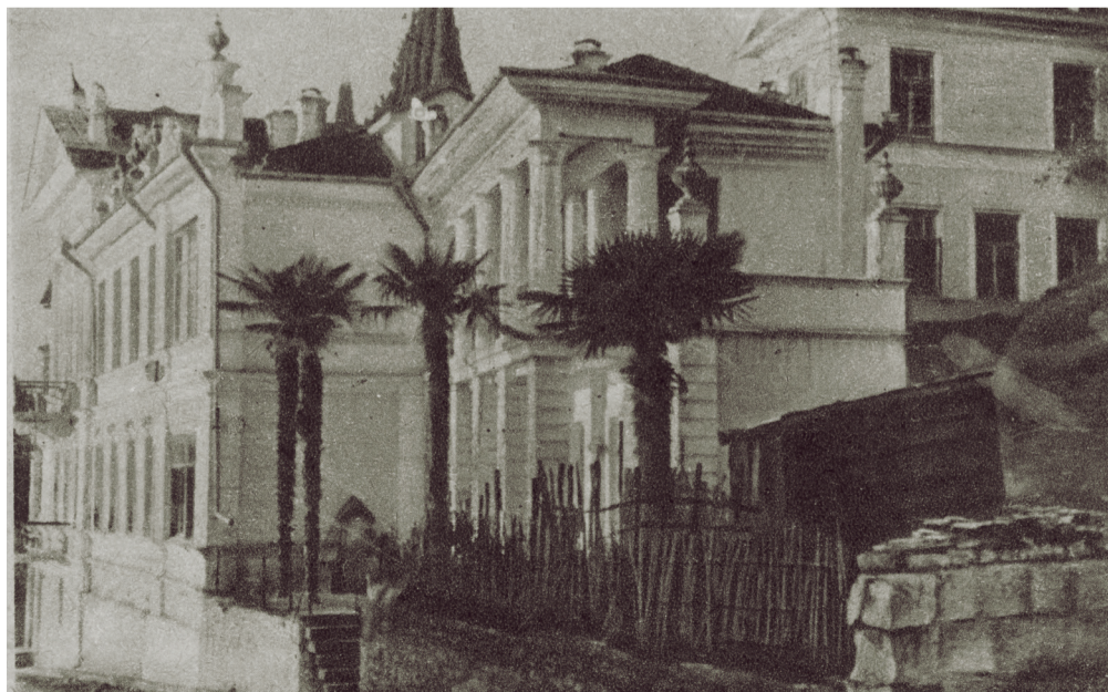
ОТЕЛЬ «ЭЛЛАДА» И ДАЧА КОМНИНО.