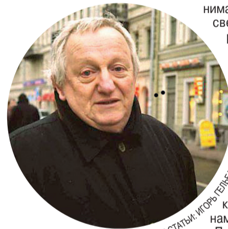
АВТОР СТАТЬИ: ГИОРГИ ГЕЛИБАЙ

27. Во времена «застоя», т.е. в конце 70-х — начале 80-х годов некоторые, довольно известные и уже отошедшие от дел сухумские «блатные» отличались подкованностью в философии и истории. Они любили неспешные философские дискуссии за бокалом вина или чашкой кофе и, пройдя свои «университеты», могли рассказать немало интересного о мире и людях.