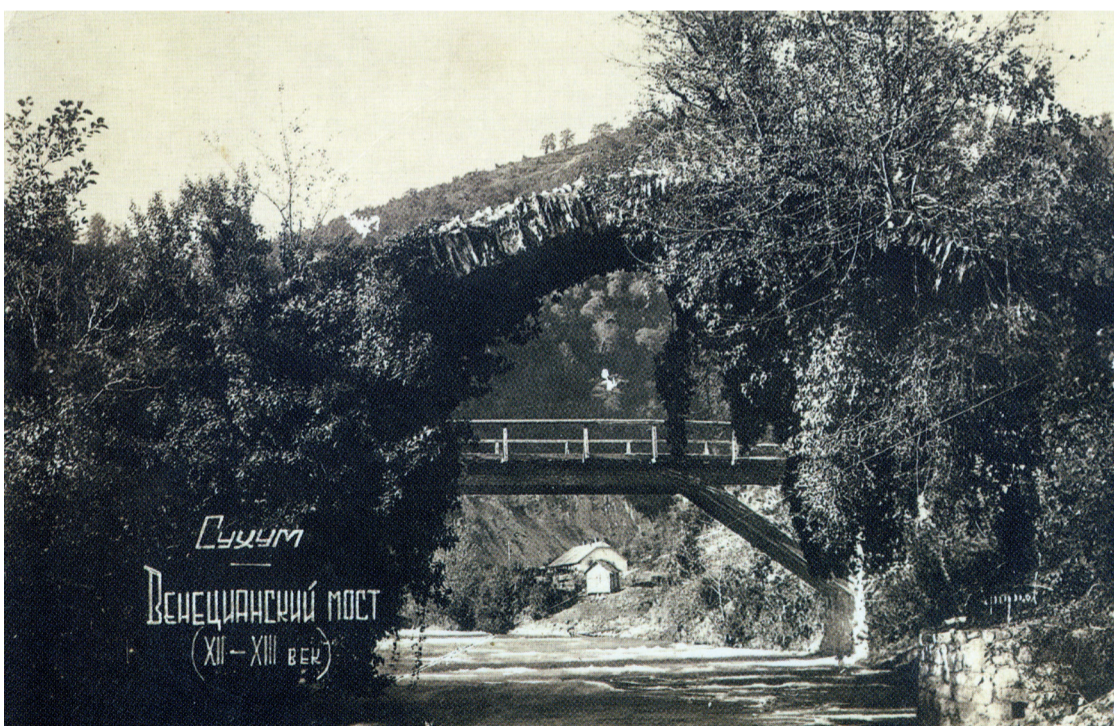
Сухум Венецианский мост (XII—XIII век)

ляющий совет и по три казначея от каждой профессиональной кооперации. Офис был расположен в здании ломбарда «Μικρά Πίστωσις» («Мелкий кредит») внизу дома Писталидиса.