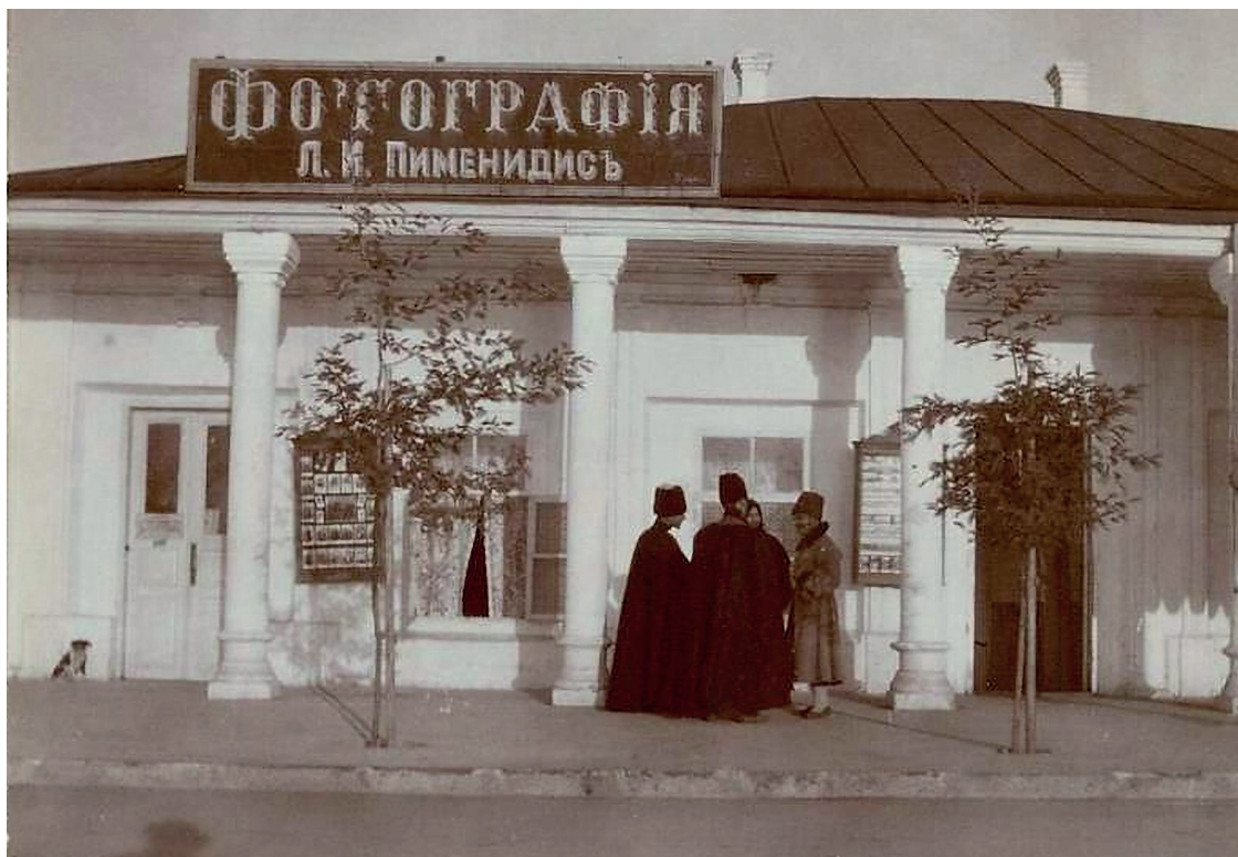
ФОТОАТЕЛЬЕ Л.И.ПИМЕНИДИСА. АВТОР ФОТО: БАРОН ДЕ БАЙ, 1903 Г.

ницы «Ориенталь» (г. Сухум) по Колубакинской ул. (сегодня Пр.Леона). В одно время именовалась как «Фотография братьев Евкарпиди», так как наряду с Иоаннисом Полихроновичем, фотографией занимался и его брат Константин.