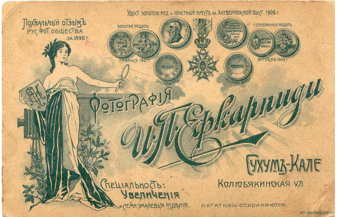
ОСНОВНОЙ ВИД ПАСПОРТУ ФОТОГРАФИЙ И. ЕВКАРПИДИ