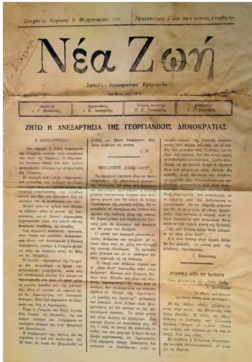
ГАЗЕТА «НЭА ЗОИ»