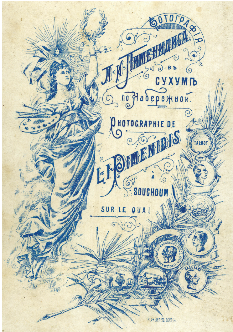
ОДИН ИЗ ВИДОВ ПАСПОРТУ ФОТОГРАФИЙ Л.ПИМЕНИДИСА.