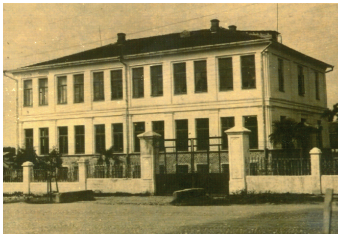
СУХУМСКАЯ ГРЕЧЕСКАЯ ШКОЛА. ФОТО. 1937 Г.