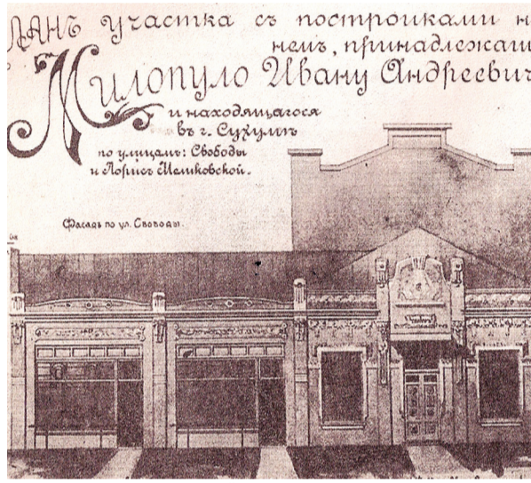
ТЕАТР САМУРИДИ, ПЕРЕШЕДШИЙ В СОБСТВЕННОСТЬ И.МИЛОПУЛО