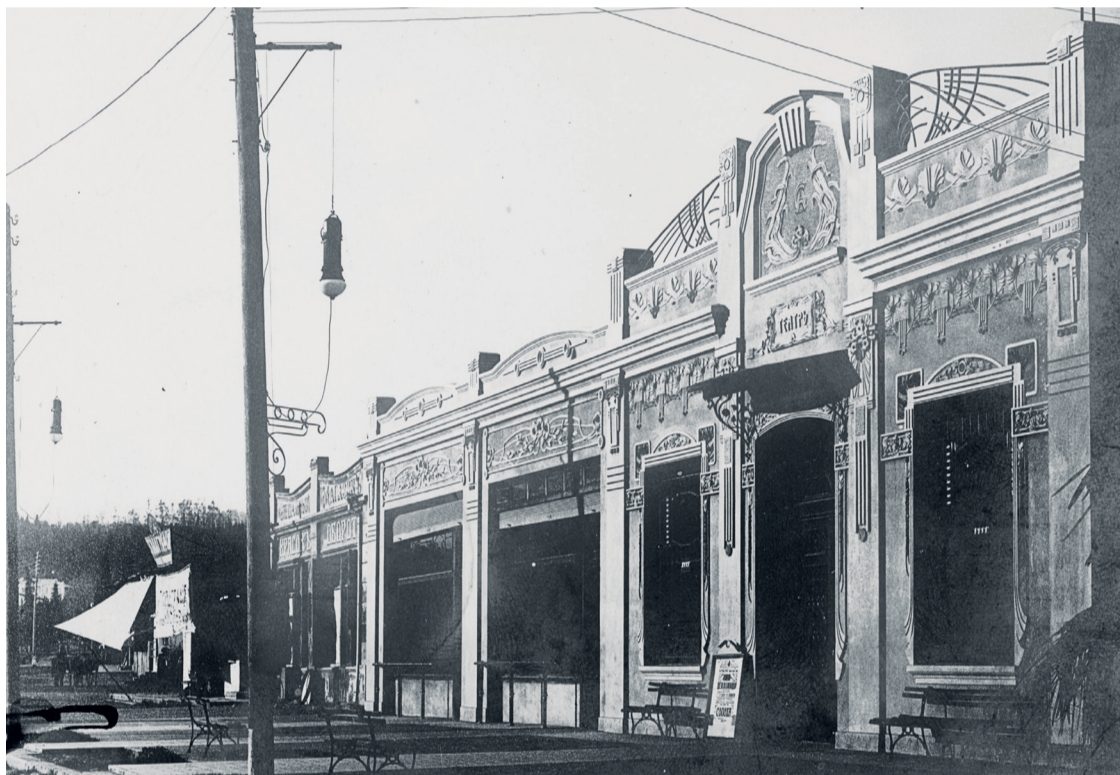
ТЕАТР А.И. САМУРИДИ. ФОТО 1911 Г. ИЗ КОЛЛЕКЦИИ Л. ЕФРЕМИДИ

лективы из центральной России, Тбилиси, Греции. Время от времени появлялись на сцене постановки местных театральных трупп — русской, греческой, грузинской, а также разных кружков.