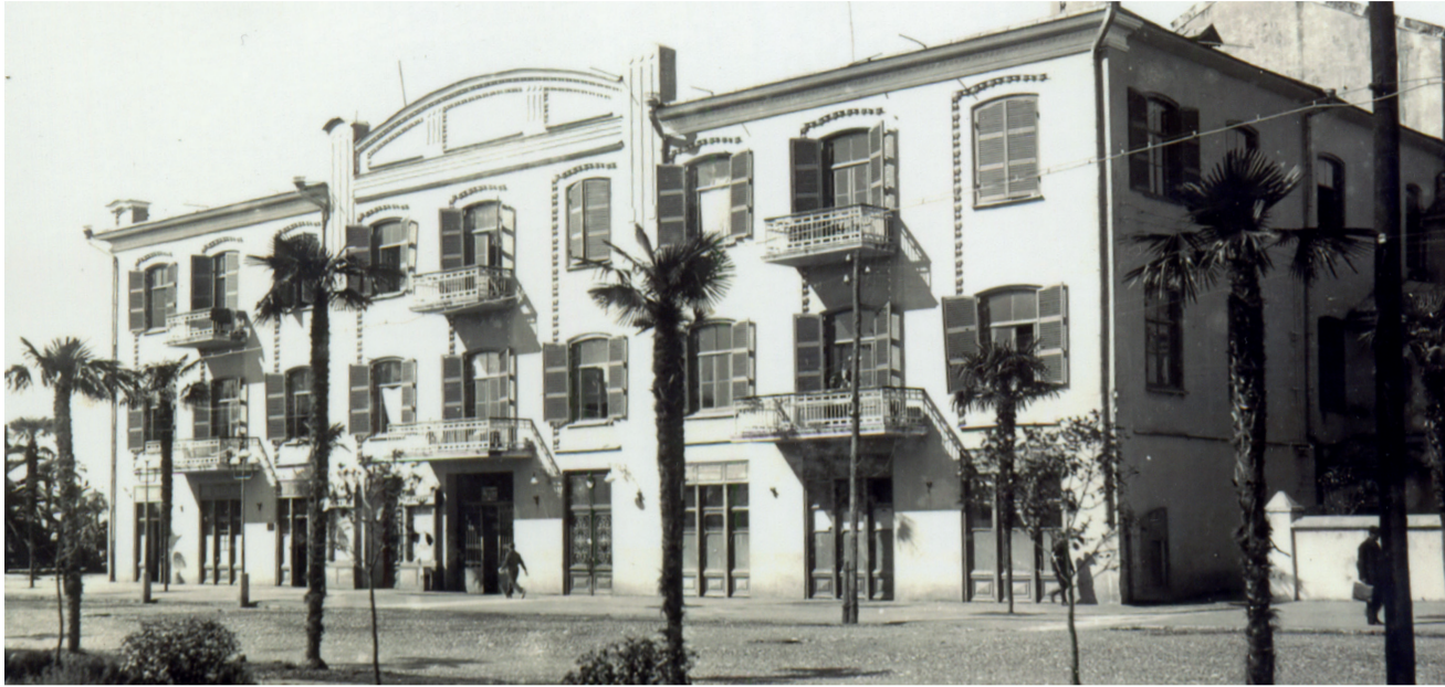
ЗДАНИЕ, В КОТОРОМ ПОМЕЩАЛСЯ ТЕАТР АЛОИЗИ