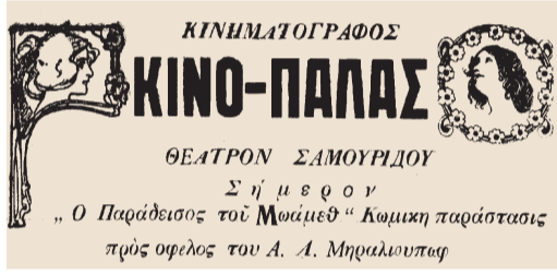
РЕКЛАМА КИНО «ПАЛАС»