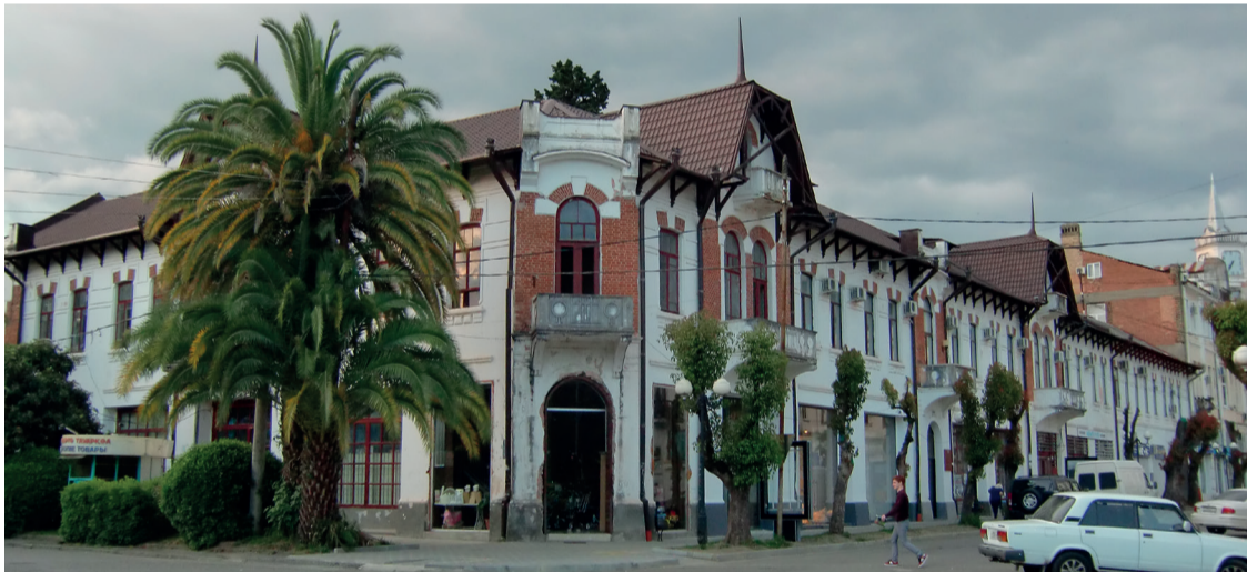
ЗДАНИЕ БЫВШЕЙ ГОСТИНИЦЫ «ЕВРОПА» М.БЕНИАТ-ОГЛЫ