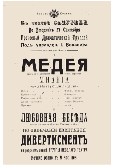
АФИША ТЕАТРА САМУРИДИ. 1916 ГОД