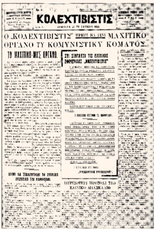
Πέριηη ΗΑΖΕΡ ΓΑΖΕΤΟΗ