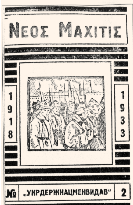
«ΝΕΟС ΜΑΧΙΤΙС», ΟΒΛΟΖΚΑ, 1933