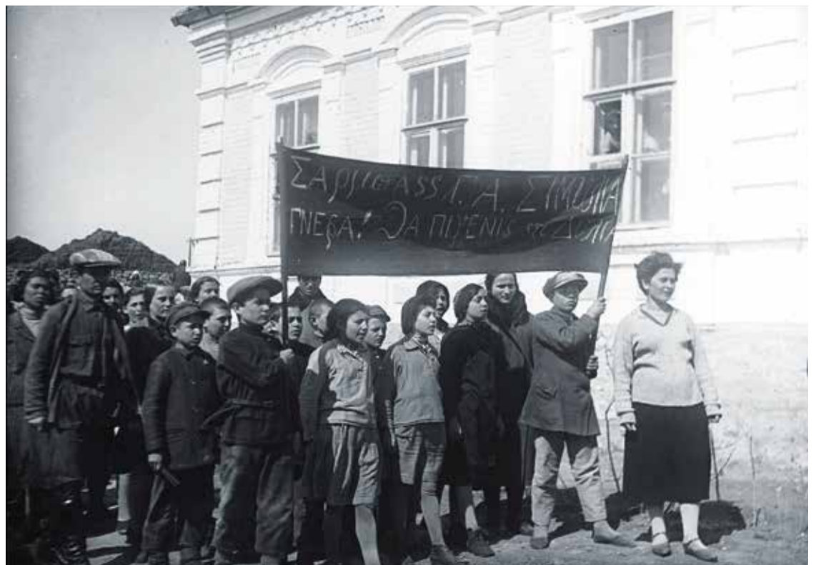
СЕЛО БУГАС. ШКОЛЬНИКИ В БОРЬБЕ С СИМУЛЯНТАМИ, 1932 г.