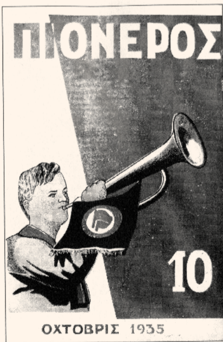
«ΠΙΟΝΕΡΟС», ΟΒΛΟΖΚΑ, 1935