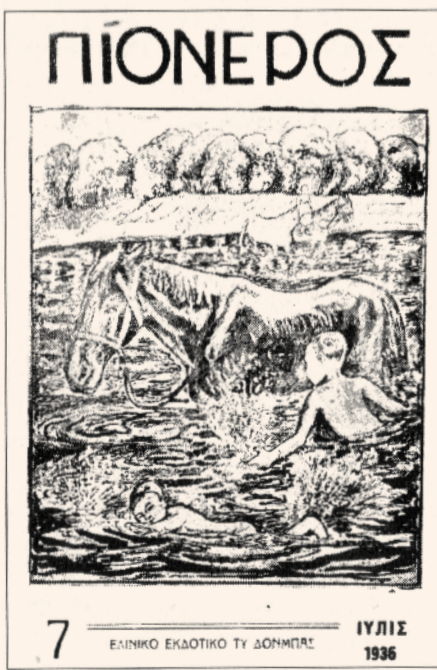
«ΠΙΟΝΕΡΟС», ΟΒΛΟΖΚΑ, 1936