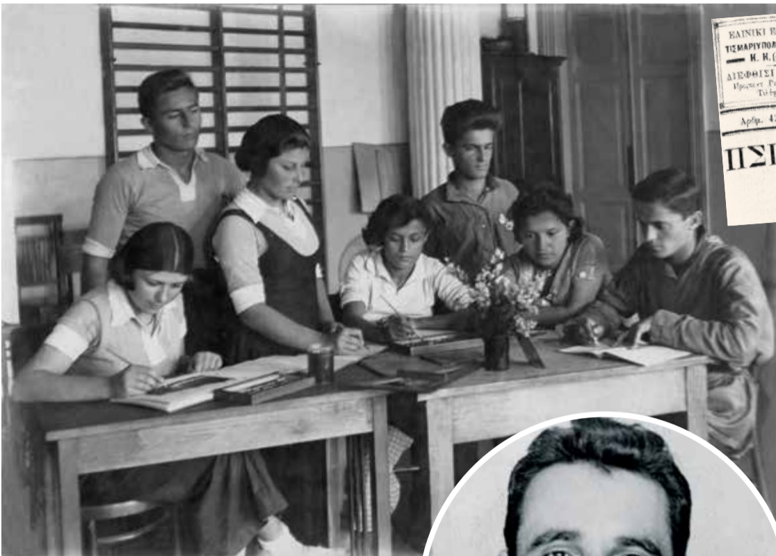
ΡΟΒΟΤΑ ΗΑΔ ΣΤΕΝΝΗΗ ΓΑΖΕΤΟΗ ΤΕΧΝΙΚΟΜΑ

греку аксиому: надо выжить, а для того, чтобы выжить, нужно ЗАБЫТЬ. Народ начал существовать с чистого листа, на котором греческие письмена могли снова стать приговором.