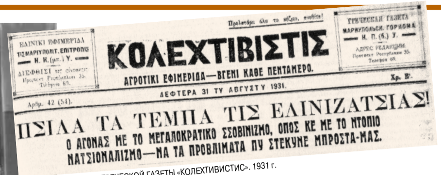
ΛΟΓΟΤΙΠ ΓΡΕΧΕΣΚΟΗ ΓΑΖΕΤΟΗ «ΚΟΛΕΧΤΙΒΙΣΤΙΣ». 1931 г.

ма, ученические тетради, уже трудночитаемые документы и ... память. Перенесли ее в новый век и поделились с авторами проекта, словно передали эстафету. Теперь, когда книга написана и издана, авторы передают эстафету Памяти уважаемым читателям.