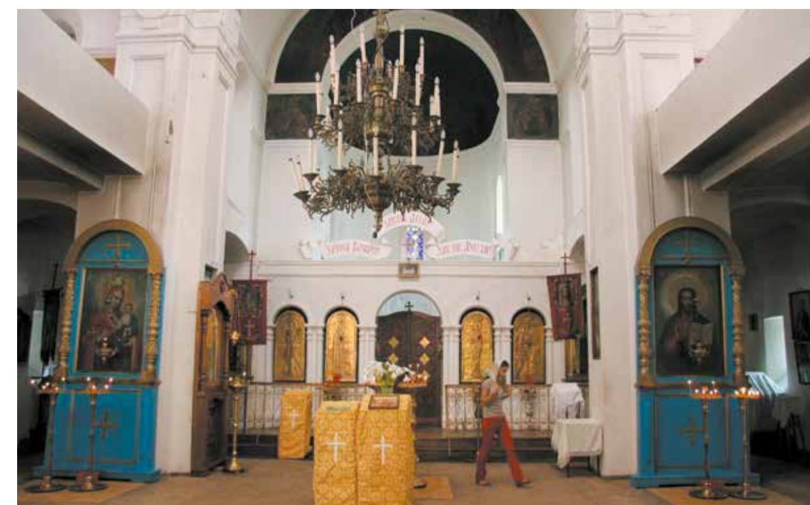
Внутреннее убранство церкви. Фото: 2015 г.

Но, согласно информации, полученной из книги Х.Сейтопулоса «Το χροϊκό της αϋθιγας και της ελπίδας», изданной в Афинах в 1985 г., во второй половине 1930-х годов греческая церковь была закрыта и в ней разместили общежитие иногородних студентов греческого педагогического техникума и учеников греческой школы, но после протеста студентов и учеников общежитие перевели в здание на противоположной стороне той же улицы.