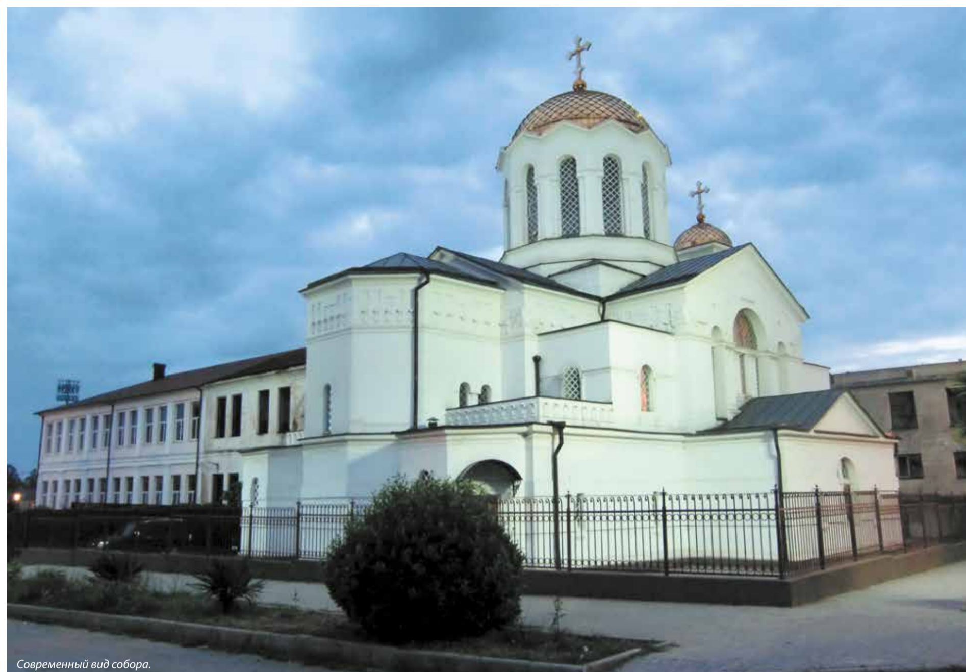
Современный вид собора.