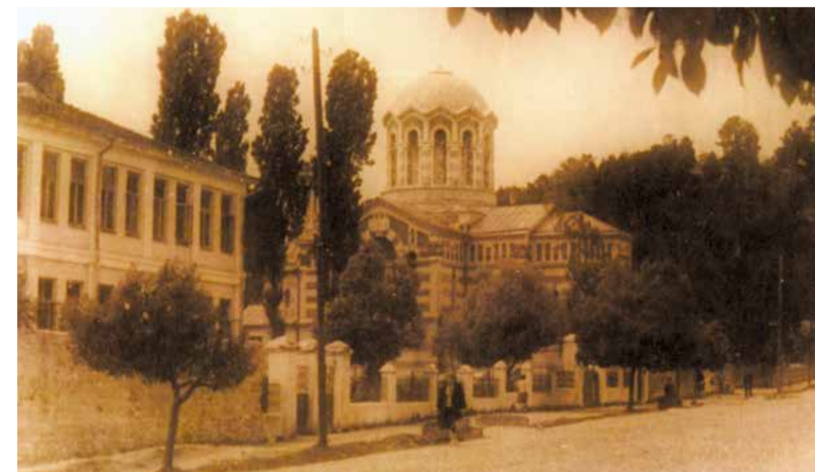
Греческие школа и церковь.