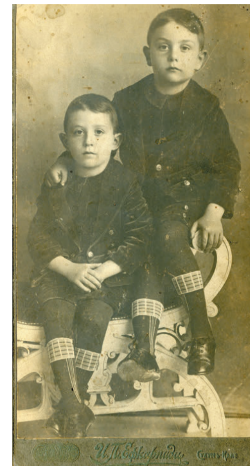
Сыновья Каллиопа Вафиади