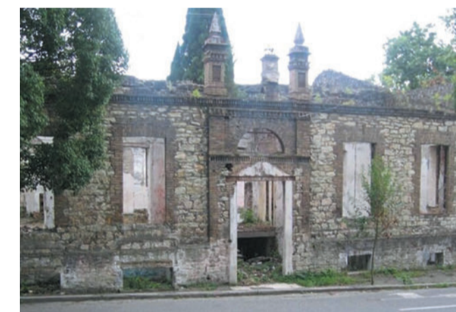
Один из домов Вафиади после частичного разрушения