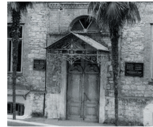
один из домов Вафиади, в котором размещался Народный суд. 1960-е годы.