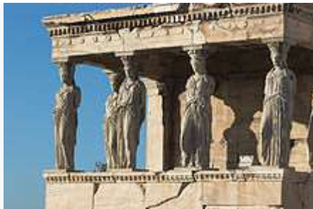
Το Ερέχθειο. Η νότια πρόσταση με τις Καρυάτιδες.