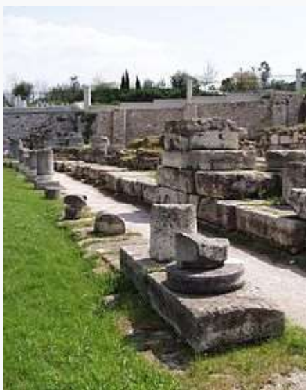
Η αρχαία συνοικία του Κεραμεικού.