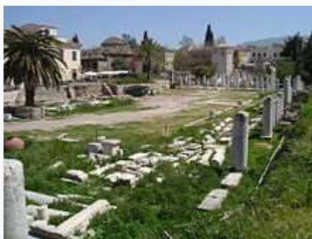
Η Ρωμαϊκή Αγορά στην Πλάκα.

Η ίδρυση της Αθήνας χάνεται στην αχλύ του μύθου, καθώς είναι γενικά αποδεκτό ότι προϋπήρχε της Μυκηναϊκής Εποχής. Είναι γνωστό ότι πράγματι υπήρχαν προϊστορικά πολιίσματα στην Αττική, αλλά από πότε ακριβώς πρωτοχρησιμοποιήθηκε για ένα τουλάχιστον από αυτά το όνομα «Αθήνα» είναι άγνωστο.