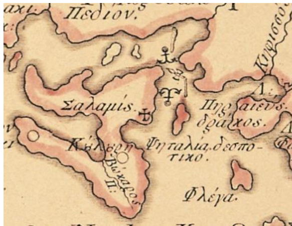
Το τσακισμένο τσεκούρι των Περσών τοποθετημένο στα στενά της Σαλαμίνας (ανάμεσα στις δύο άγκυρες).

Τα σύμβολα αυτά τα καταχωρίζει στα ιστορικά γεγονότα, που σημειώνει στην Χάρτα του. Συγκεκριμένα στο 5 ο φύλλο, στην περιοχή του Μαραθώνα συμβολίζει την ελληνική νίκη το 490 π.Χ. με το ρόπαλο του Ηρακλέους και τσακισμένο το διπλό πέλεκου, την ηττημένη περσική δύναμη. Παρόμοια και στην ναυμαχία της Σαλαμίνας του 490 π.Χ., καθώς και μια δεκαετία αργότερα στην ναυμαχία της Μυκάλης της